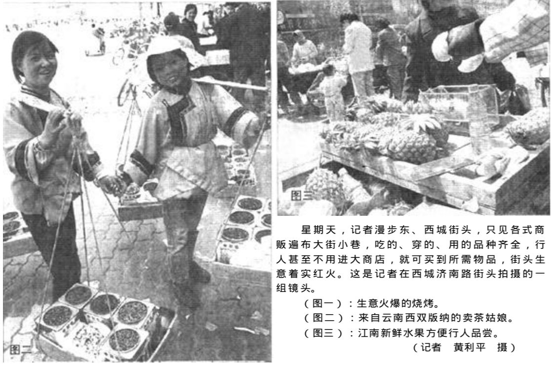
星期天，记者漫步东、西城街头，只见各式商贩遍布大街小巷，吃的、穿的、用的品种齐全，行人甚至不用进大商店，就可买到所需物品，街头生意着实红火。这是记者在西城济南路街头拍摄的一组镜头。

(图一)：生意火爆的烧烤。 (图二)：来自云南西双版纳的卖茶姑娘。 (图三)：江南新鲜水果方便行人品尝。 (记者 黄利平 摄)